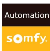
Accionamiento manual, con posibilidad de motorizarlo