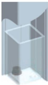
Sujeciones ocultas para estructura.