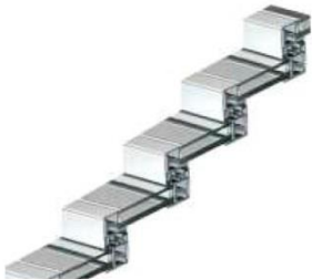
Apertura de 50%, 66%, 75%, 83%